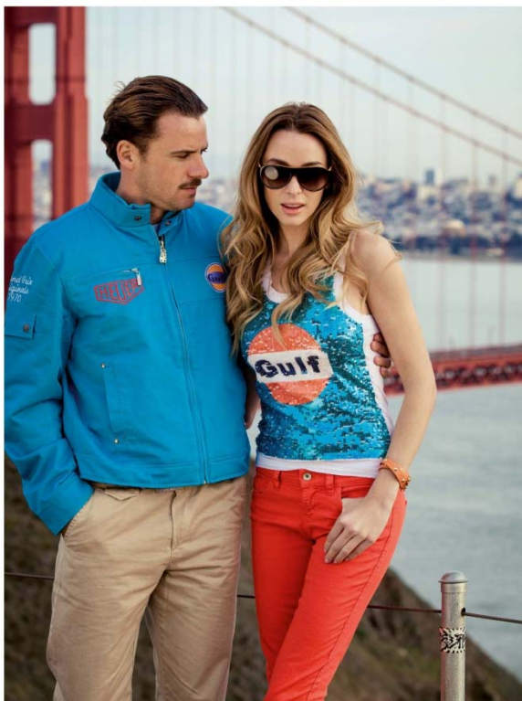
Style SPORT DRIVEMASTER TURQUOISE

ปัจจุบัน Gulf เป็นมากกว่า “น้ำมัน” ทั้งนี้ Gulf ยังเป็นที่รู้จักในวงการแฟชั่น ซึ่งผ่านการดำเนินการโดย Grand Prix Originals ซึ่งเป็นศูนย์รวมทั้งเสื้อผ้า กระเป๋าถือ และสินค้าอื่น ๆ ที่มีโลโก้ของ Gulf นอกจากนี้ Gulf ยังได้ร่วมมือกับผู้ผลิตนาฬิกาชั้นนำของโลก เช่น Tag Heuer และ BRM อีกด้วย